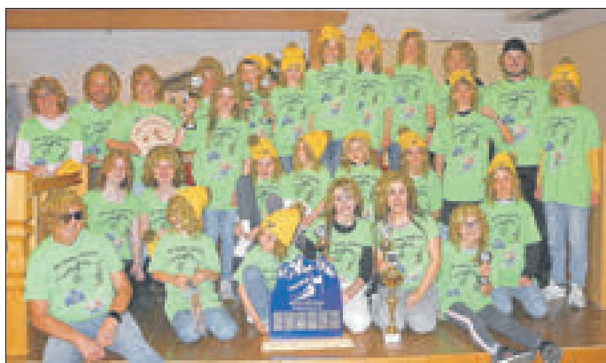
Das Mannschaftssieger-Team des TSV Palling mit dem Nordcup-Wanderpokal

https://www.tsv-palling.de/abteilungen/ski/ski-ergebnisse